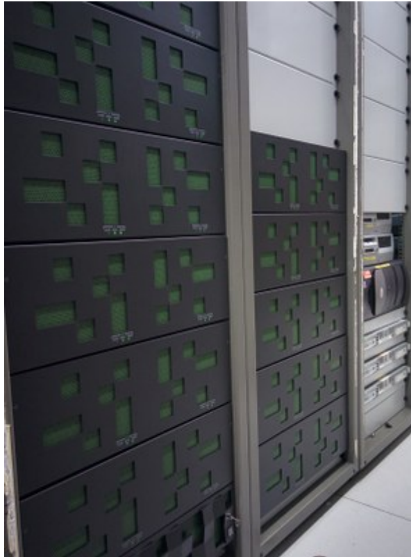
vue arrière vue de face

From: https://doc.eresearch.unige.ch/ - eResearch Doc