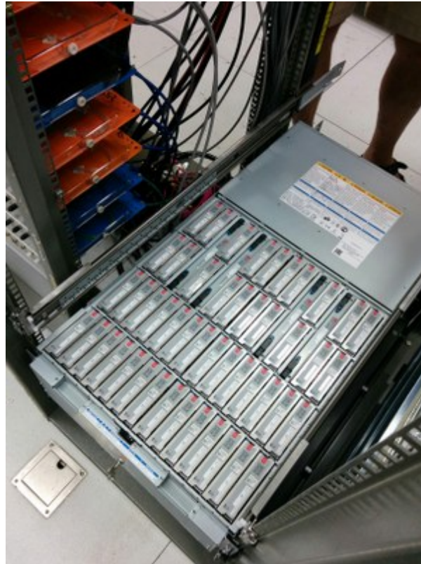
Un des 7 châssis contenant les disques