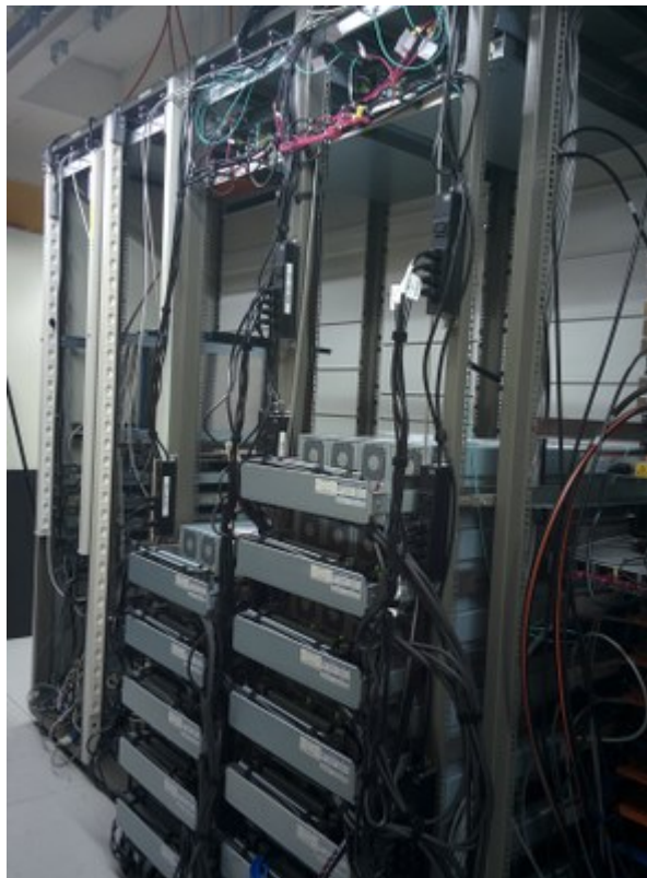
Installation terminée, vue arrière